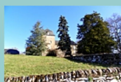
château de Salgues