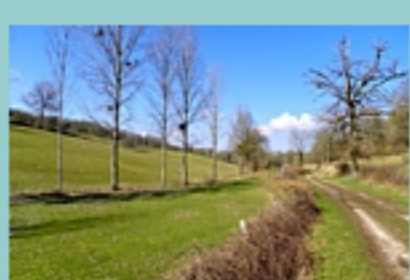
vallon après Goubert

Image obtenue avec le logiciel gratuit GpxTraceNet v5.4 http://www.gpspassion.com/upload2/teepy_GpxTraceNet.zip