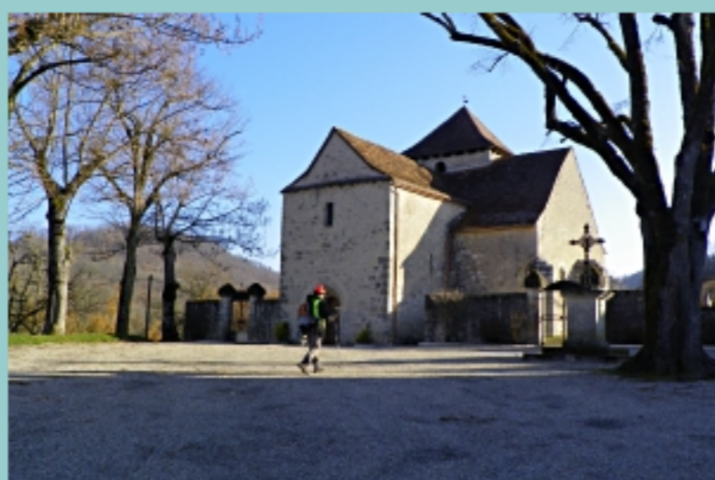
église de Brouelle