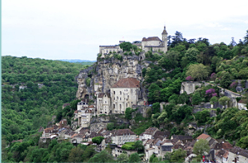
la cité de Rocamadour