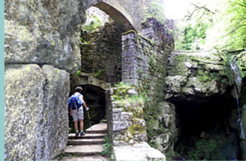
le Moulin du Saut

26km - Ce circuit utilise des portions de boucles balisées en jaune, avec panneaux indicateurs ( épi de blé) et une portion de piste équestre orange