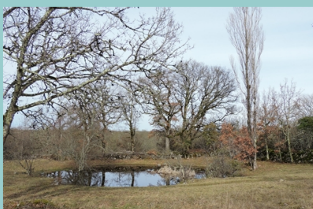
Le Lac des Fargues