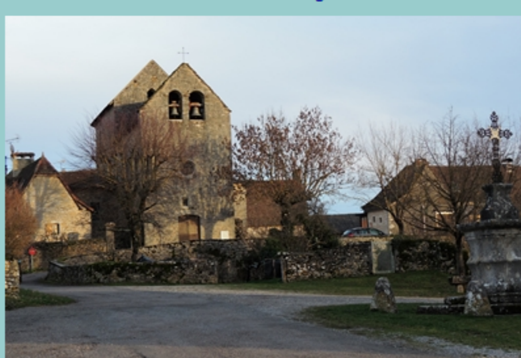
L'église de Reilhac au soleil couchant