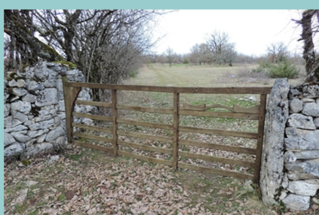
Clède bien reconstituée