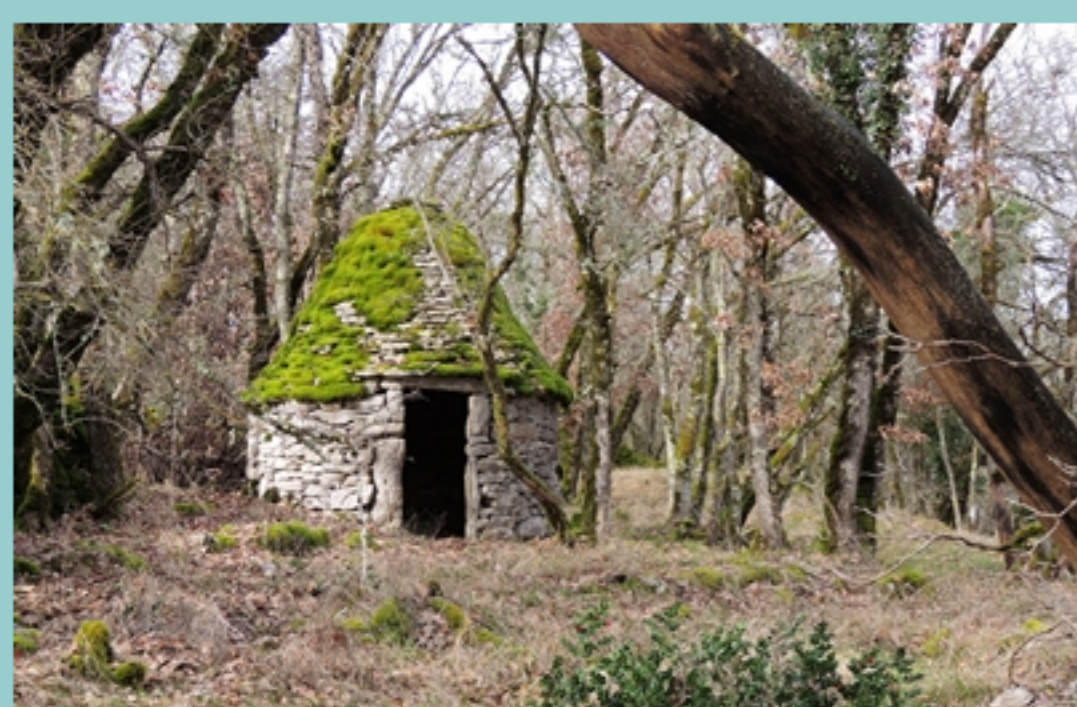
Gariotte avant La Balmette