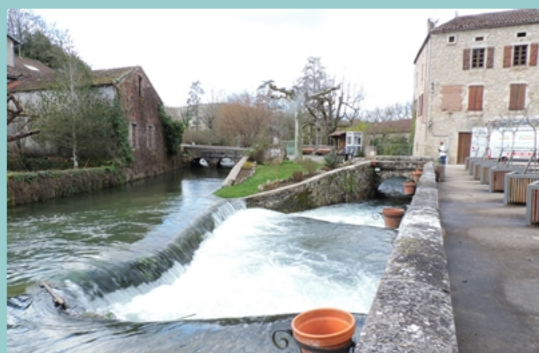
St Vincent, Le Bondoire