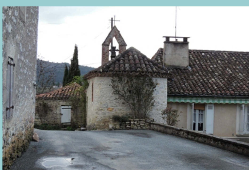
à l'arrivée dans St Vincent, petite chapelle