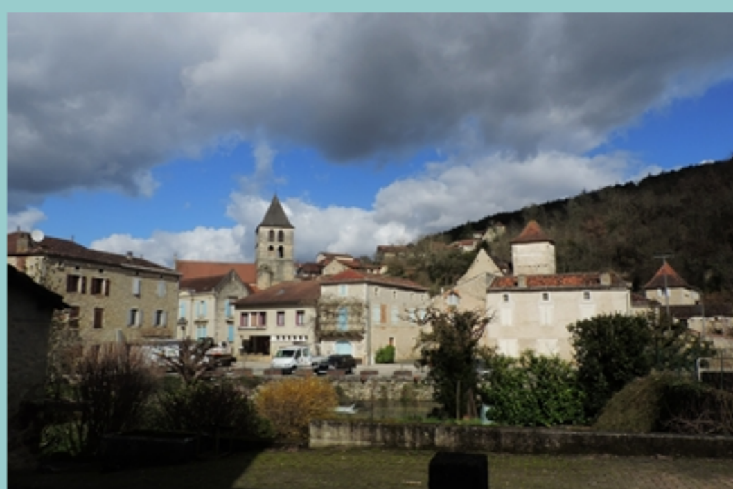
St Vincent, vue générale