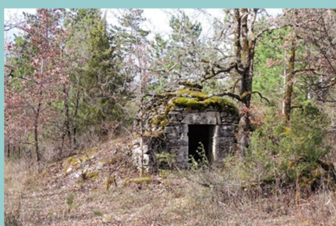
Sur GR 36, gariotte