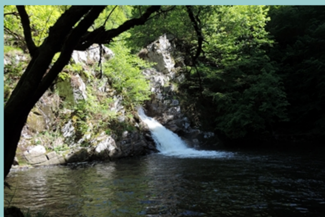
cascade de Vieyres