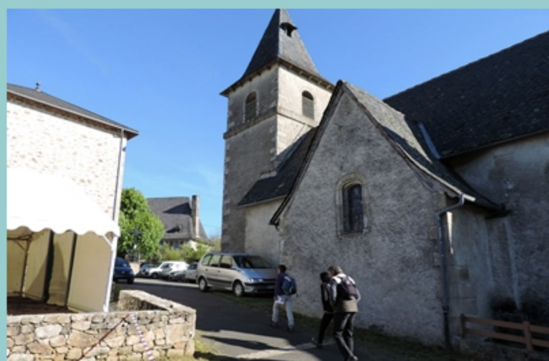
église de Lamativie