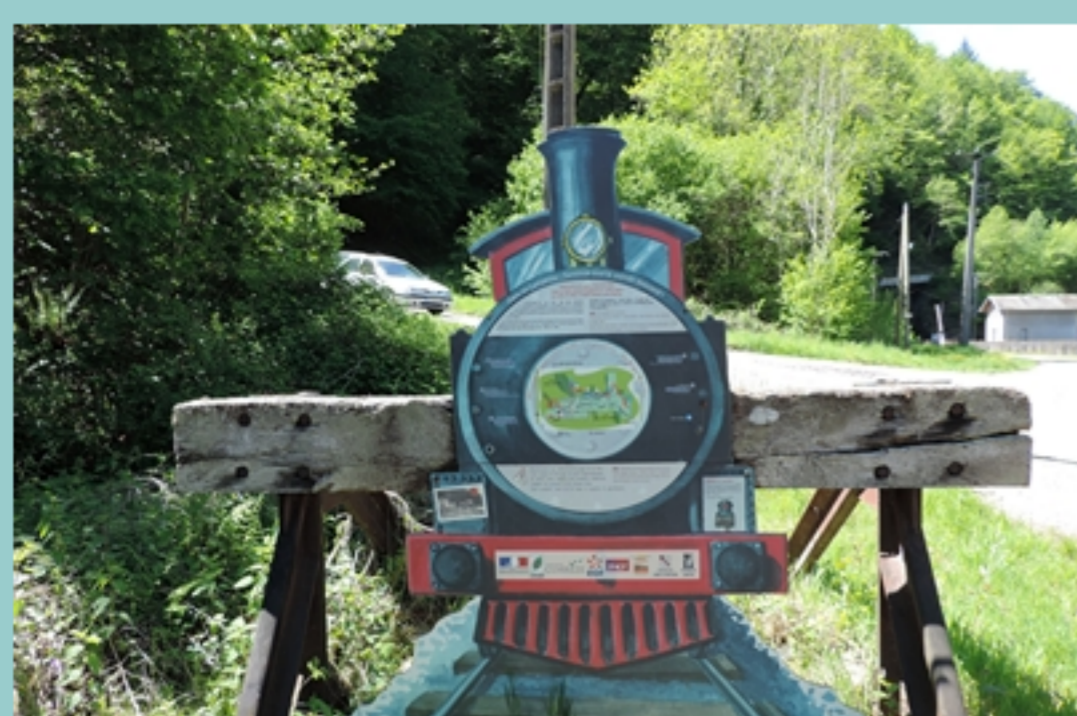
à la gare de Lamativie