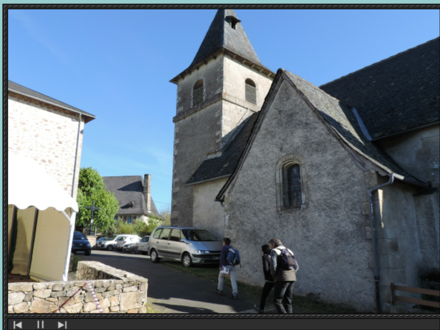
Bonne rando, lotois !