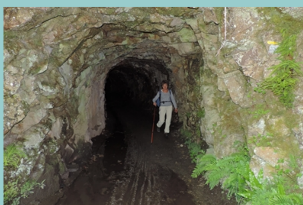
le tunnel ...

Un clic sur le titre pour voir la trace sur Visugpx)