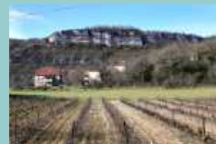
Lagardelle vu de la vigne

Pour plus d'infos mail lotois@infonie.fr demander copie carte