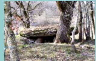
dolmen 3 combel du ravié