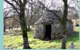
gariotte à la sortie de ST-Chels