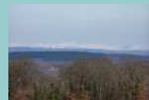
au loin les sommets enneigés du Cantal