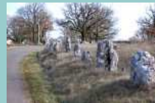
arrivée à St-Chels