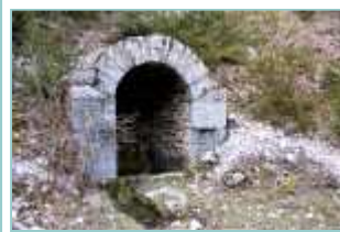
la source au poisson