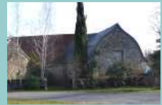
grange au toit en carène inversée