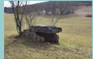
dolmen 4 combel du ravié