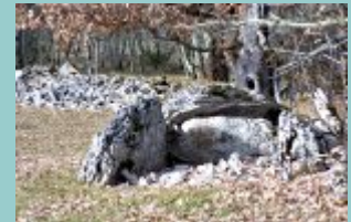
dolmen 2 combel du ravié