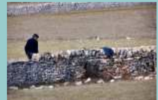
restauration mur de pierre sèche